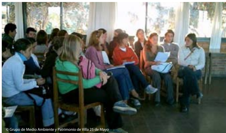
© Grupo de Medio Ambiente y Patrimonio de Villa 25 de Mayo

La determinación de estos/as vecinos/as de no quedarse de brazos cruzados los llevó a presentar un proyecto ante el Programa de Pequeñas Donaciones, perteneciente al Fondo Mundial para el Medio Ambiente (FMAM, más conocido por su sigla en inglés como GEF), que es implementado por el Programa de Naciones Unidas para el Desarrollo (PNUD). El proyecto fue aprobado y se desarrolló en el período de octubre de 2006 a agosto de 2009.